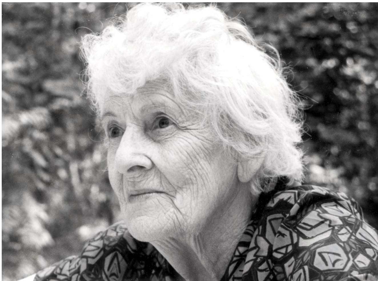
1992, Kratovo.